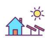
Installations sur site

Dans vos communications, il est important de spécifier "électricité renouvelable" si vous n'utilisez que de l'électricité labellisée EKOénergie. Ceci afin d'éviter toute désinformation si les autres sources d'énergie que vous utilisez ne sont pas des énergies renouvelables labellisées EKOénergie.