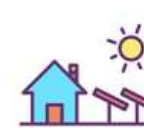
Installations sur site

Dans vos communications, il est important de spécifier "électricité renouvelable" si vous n'utilisez que de l'électricité labellisée EKOénergie. Ceci afin d'éviter toute désinformation si les autres sources d'énergie que vous utilisez ne sont pas des énergies renouvelables labellisées EKOénergie.